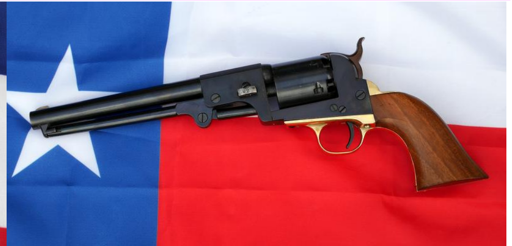
From left: Mississippi made 1862 Leech & Rigdon, Texas made 1862 Dance & Brothers Navy

In all likelihood further rare and unusual Neo-Classikers of conversions' fame can be observed in action at the Centaure Match on September 18, 2021: Colt 1847 Walker Long Cylinder Field Conversion or Richards-Mason Connecticut Conversions , 1862 Tucker & Sherrards "Texas" Field Conversions , possibly one or more Centaure Richards (R1) and also short barreled variants of the "Mystery" conversion .