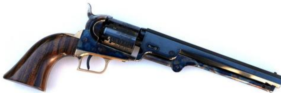
Uberti Miniature Colt 1851 Navy #777, 1:2.125 scale, selected wood

Der Erlös dieser speziellen Verkaufsaktion geht an unseren Gastgeber, den SSV Rütthen e.V. Also, steckt bitte genügend Geld ein und bietet großzügig!