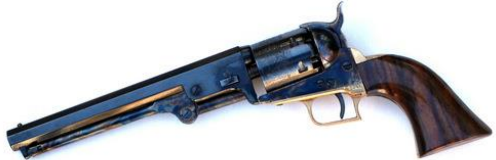
Uberti Miniatur Colt 1851 Navy #777, Maßstab 1:2.125, ausgewähltes Holz