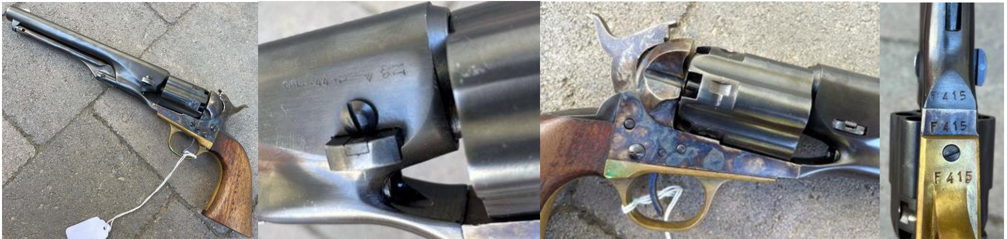
Impressions of rare Centaure Cavalry 1 st var./2 nd sub-var. #F415/Eindrücke vom seltenen Centaure Cavalry 1. Var./2. Subvar. #F415

Seit einiger Zeit endlich wieder der ein Cavalry 1. Variation/2. Subvariation. Typisch ist das halbrunde, fast flache 4. Schraubenpaar, wie es sich gehört ohne Anschlagschaft, ein aufrechter stehender Centaure als Logo: #F415 ist von ca. 1962, Inspektorenzeichen * über U (Jaques Fuchs 1960 – 68) an den drei korrekten Stellen, die stimmige Laufbeschriftung der frühen 1960er Jahre "1960 NEW MODEL ARMY" https://www.gunbroker.com/item/975802461 .