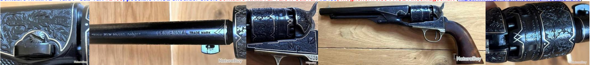
Centaure RNMA 5 th var./1 st sub-var., 2 nd half of 1960s, custom engraved/Centaure RNMA 5. Var./1. Subvar., aus der 2. Hälfte der 1960er, graviert ( https://www.naturabuy.fr/Colt-Centaure-Centennial-1860-Army-Grave-item-9168488.html )