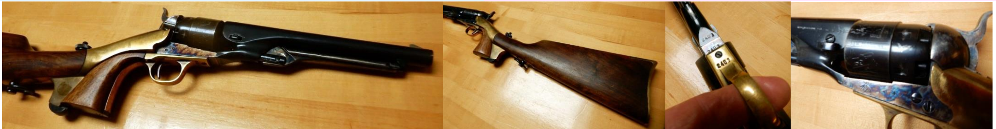
Centaure RNMA 2 nd var./1 st sub-var. #2403, possible FAUL shoulder stock/Centaure RNMA 2. Var./1. Subvar. #2403, möglicherweise FAUL-Anschlagschaft ( https://www.gunbroker.com/item/992254619 )

Ein Tag, der mit der Entdeckung eines Centaure beginnt, ist ein guter Tag