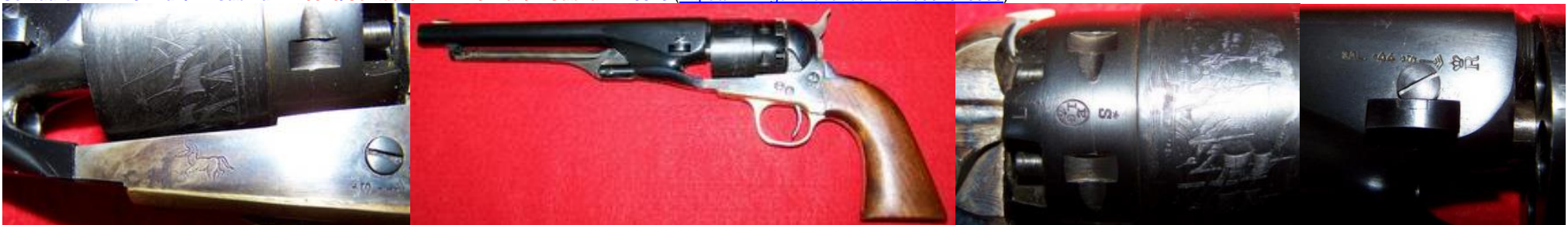
Centaure RNMA 3 rd var./3 rd sub-var., made before Feb. 28, 1968/Centaure RNMA 3. Var./3. Subvar., hergestellt vor 28.02.1968 ( https://www.gunbroker.com/item/997558213 )