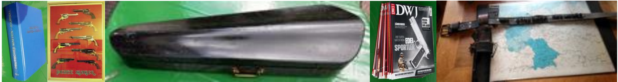
More of the goodies for the July 29, 2023 auction/Weitere der Schätzchen für die Auktion am 19. Juli 2023