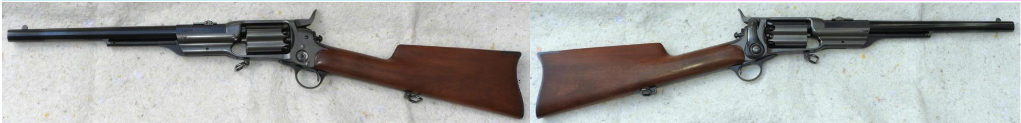
Hefner made and marked - Colt 1855 Root Carbine - 15" barrel/Hefner hergestellt und gestempelt - Colt 1855 Root Carbine - Lauflänge 15"