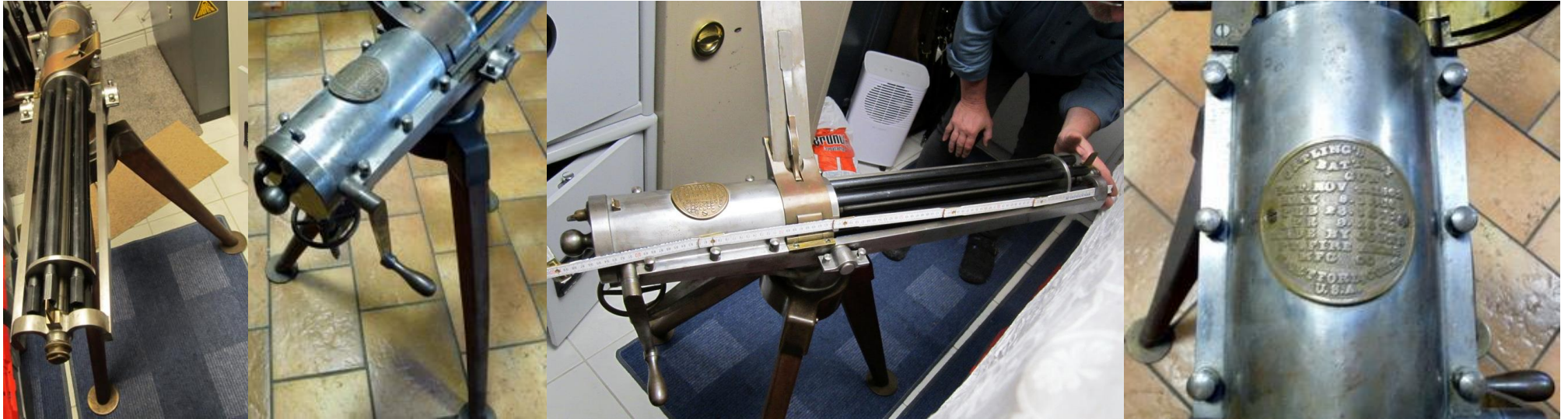
A Gatling - the dream-gun of Cowgirls & Cowboys/Eine Gatling - Traumwaffe von Cowgirls & Cowboys

kannten Bastler, steigern hoffentlich Euere Vorfreude die Ausstellung am 30.Juli 2023 zu besuchen.