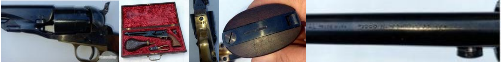
Centaure RNMA 1 st var./2 nd sub-var. #10888, custom cased/Centaure RNMA 1. Var./2. Subvar. #10888, im Kasten ( https://www.naturabuy.fr/Revolver-Centennial-1860-New-Model-Army-item-10708327.html )

A few current Centaure Auctions (see above) at Gunbroker in the USA, i. e. RNMA 3 rd var./2 nd sub-var. #10573 and RNMA 3 rd var./3 rd sub-var. serial number not known. Judged by its characteristics manufactured between 1965 and 1968; discovered at Naturabuy in France RNMA 1 st var./2 nd sub-var. #10888.